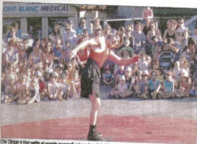
Che Cirque a ravi petits et grands mercredi soir sur le pré de foire.

L es temps forts pour "Les enfants d'abord" sont aussi pendant les spectacles, à 18h45 tous les jours sur le pré de foire.