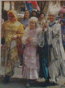
Тильский театр «Земитаж» — вдохновитель