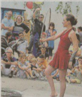
L'Absurdus compagnie, cirque absurde, mais numéros précis !

Voir notre vidéo sur www.ouest-france.fr/la-roche