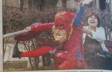
Уличные спектакли тем и хороши — поучаствовать может каждый!