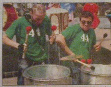
Звуковой «бомбой» праздника стало барабанное шоу группы «44 Drums» из Архангельска.