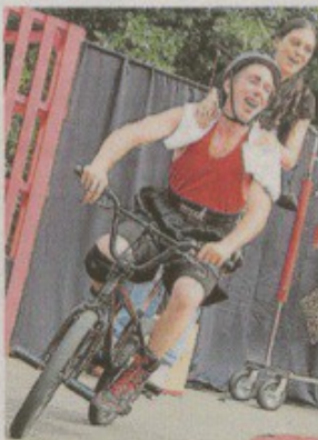
L'atout de la cie Che cirque ? Du spectacle participatif. Le public est hésitant, puis en redemande !