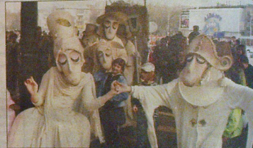
Странствующие куклы господина Пэжо играючи собрали толпу зевак, а потом устроили сказочный спектакль про любовь, мечты и романтиков.