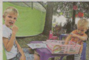
La Cimade tenait un stand pour rechercher de nouveaux bénévoles. Contact : ven-dee@lacimade.org/ . Jeux et détente étaient les maîtres-mots de cette journée.